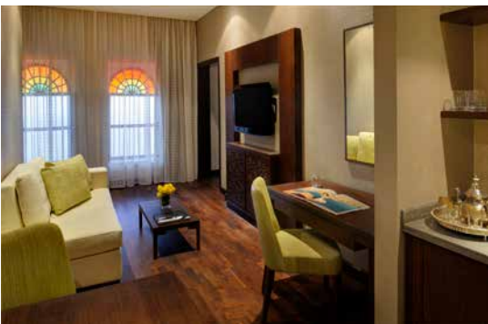
غرفة الجلوس - غرفة دولوكس