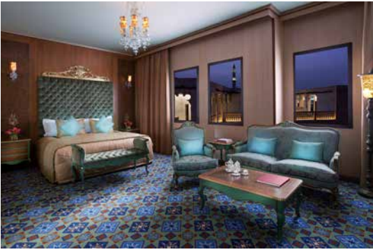
غرفة ستاندرد بسريرين