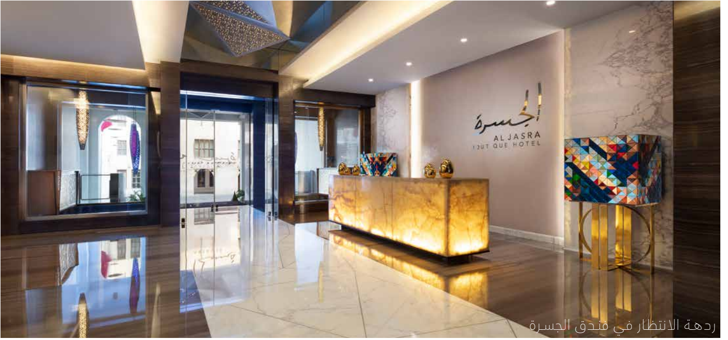
ردهة الانتظار في فندق الجسرة