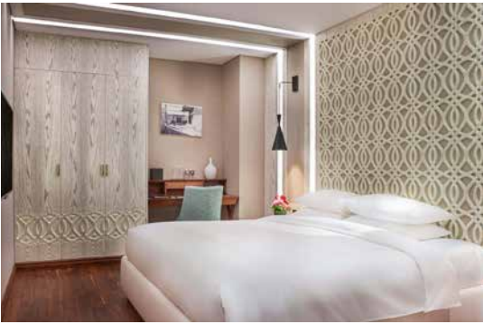
غرفة النوم - الجناح التنفيذي