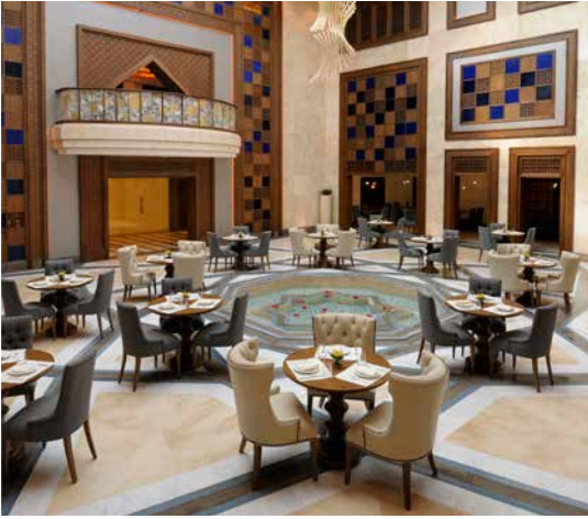
مطعم لا بيتازا