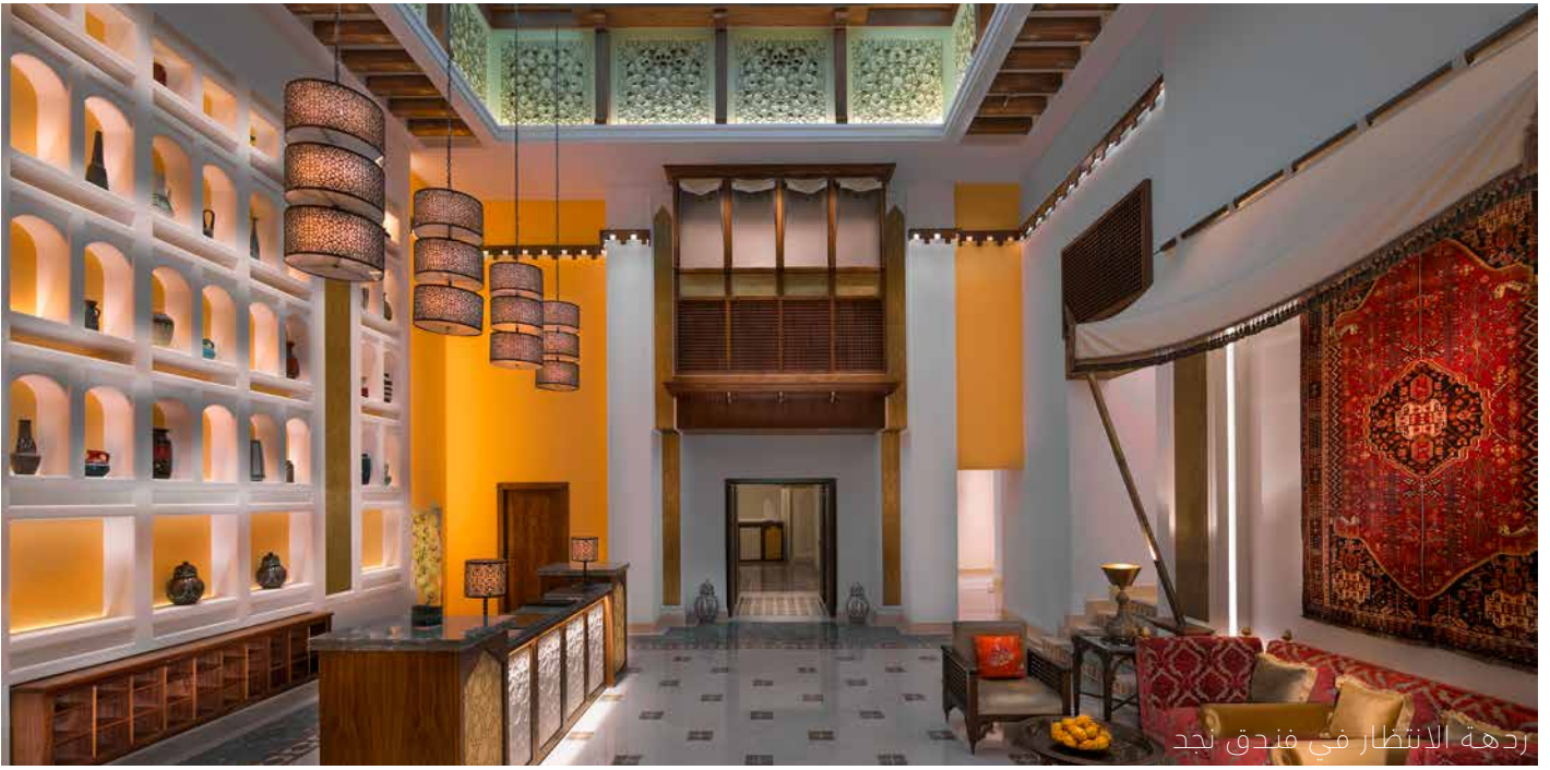
ردهة الانتظار في فندق نجد