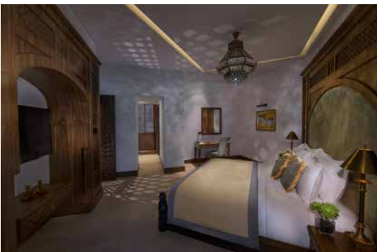
غرفة النوم - الجناح التنفيذي