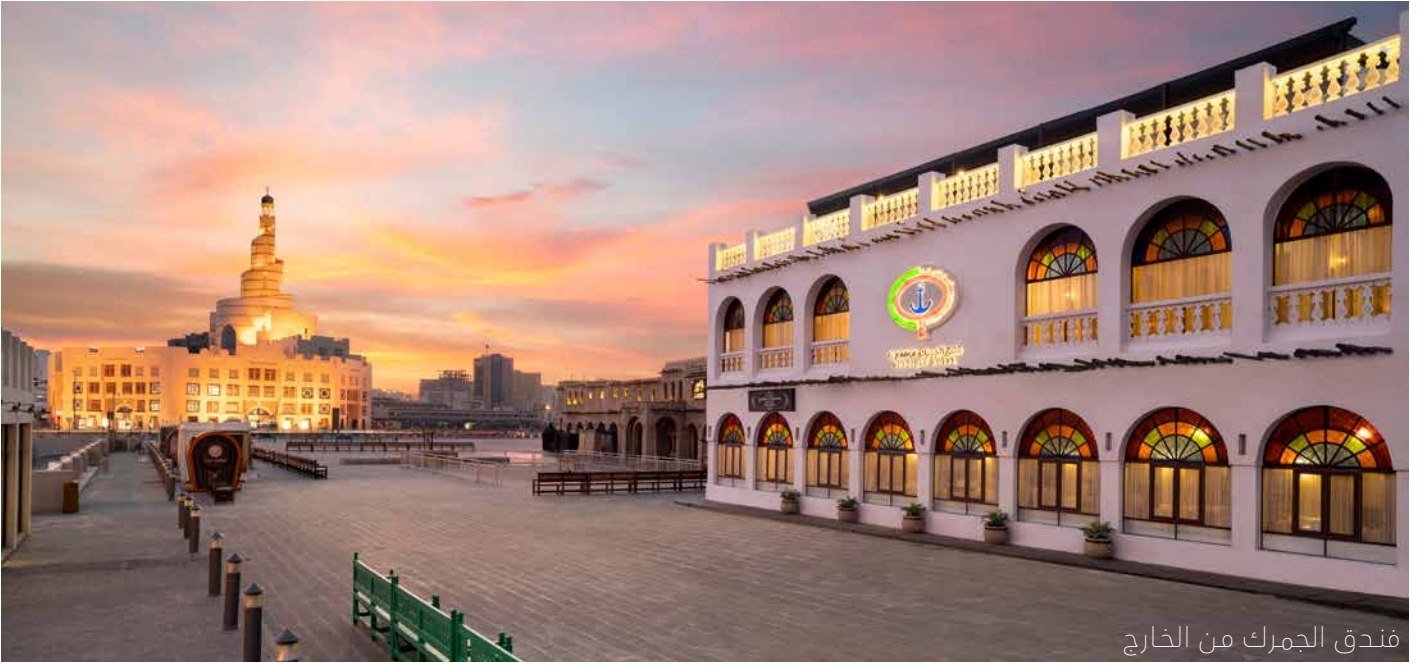
فندق الجمرک من الخارج