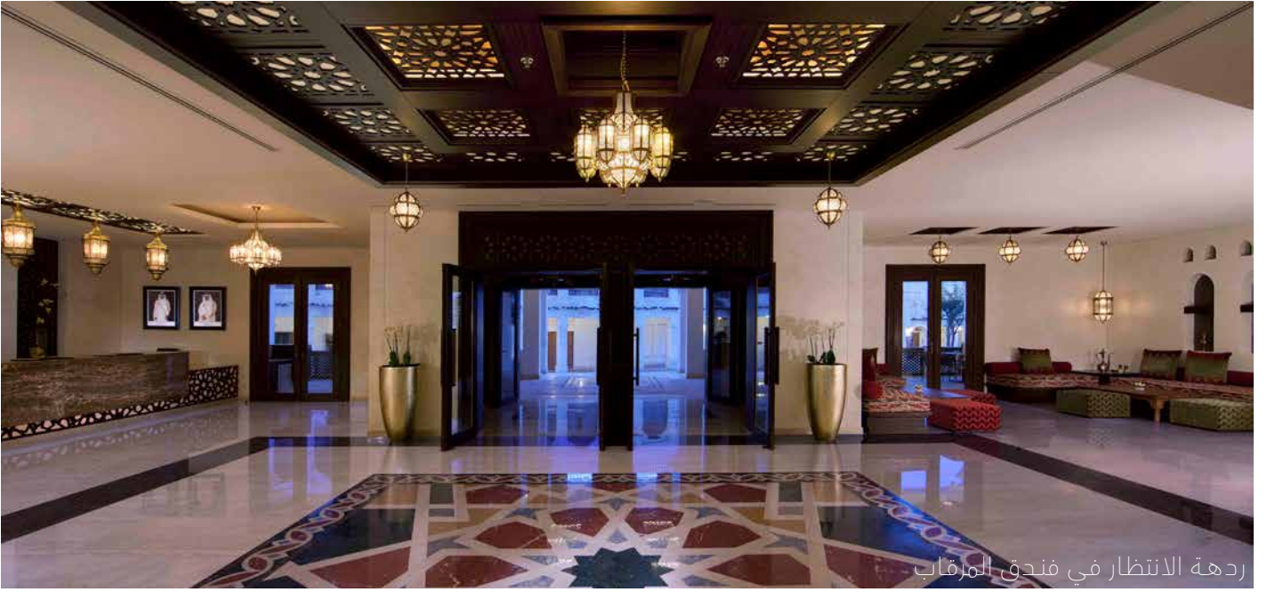
ردهة الانتظار في فندق المرقاب