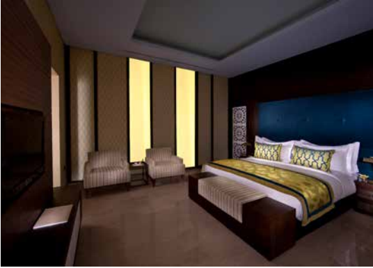
غرفة النوم - جناح دولوكس