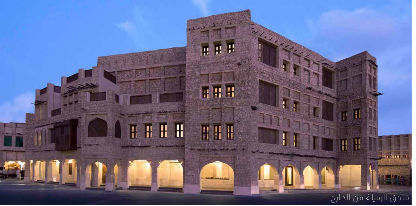
فندق الرملة من الخارج