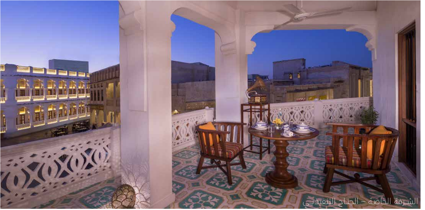
الشرفة الخاصة - الجناح التنفيذي