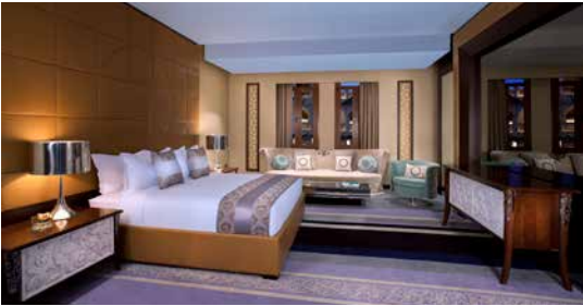
غرفة النوم - الجناح الأميري