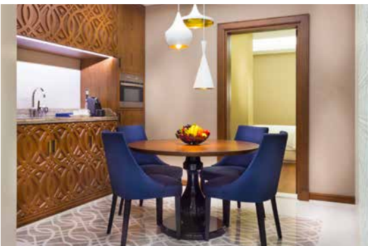
غرفة الطعام - الجناح التنفيذي