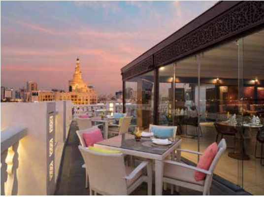
مطعم الشرفة العربي

يوجد في الفندق ١٣ غرفة تعكس التصميم المترف الحديث بأحسن ما يكون. تجمع الغرف بين ديكور الماضي التقليدي والمرافق المعاصرة. تعبق ردهة الانتظار العربية بأقمشة غنية الألوان، كما نجد في كل غرفة أثاث خشبي مصمم حسب الطلب. يمكن للنزلاء أن يتمتعوا بأعمال فنية لمصممين دوليين رائدين والاستمتاع أيضاً بمشاهدة سوق واقف لحفر ذكريات خالدة في ذهنهم.