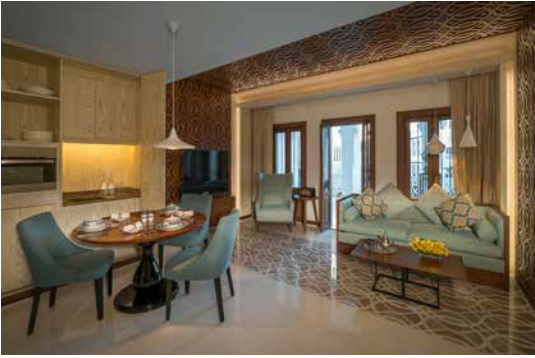
غرفة الطعام وغرفة الجلوس - الجناح التنفيذي