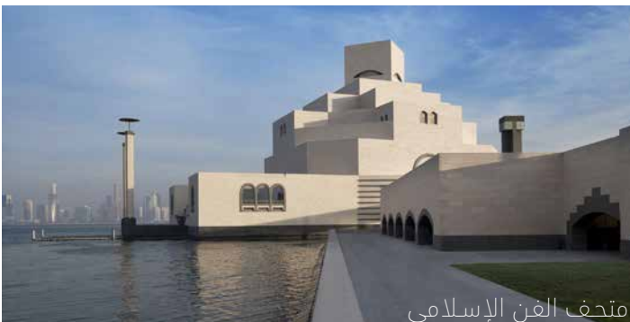
متحف الفن الإسلامي